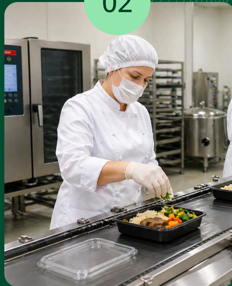
ПРОИЗВОДСТВО ГОТОВОЙ ЕДЫ